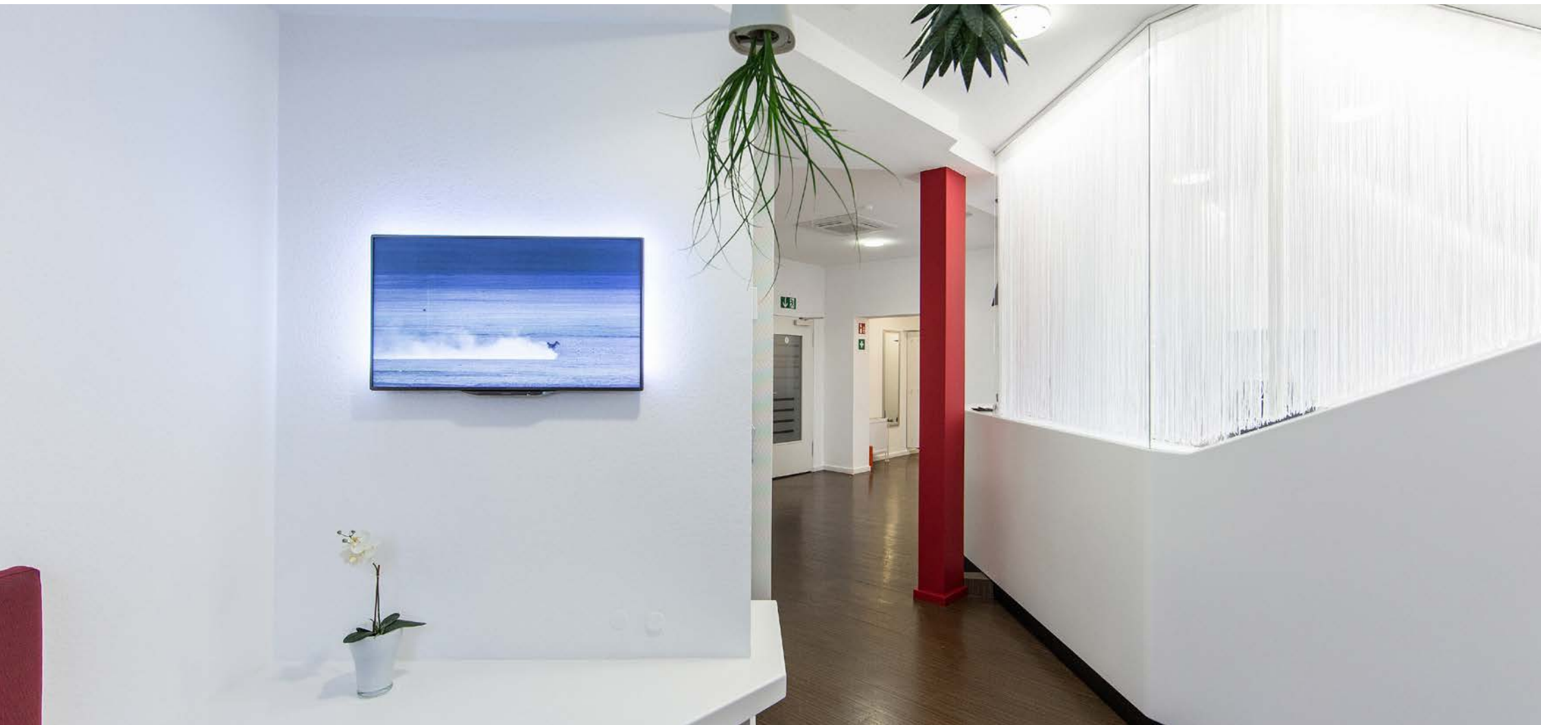
ZAHNARZTPRAXIS STICKEL & STICKEL Architekt: Jung+Klemke, Wetzlar