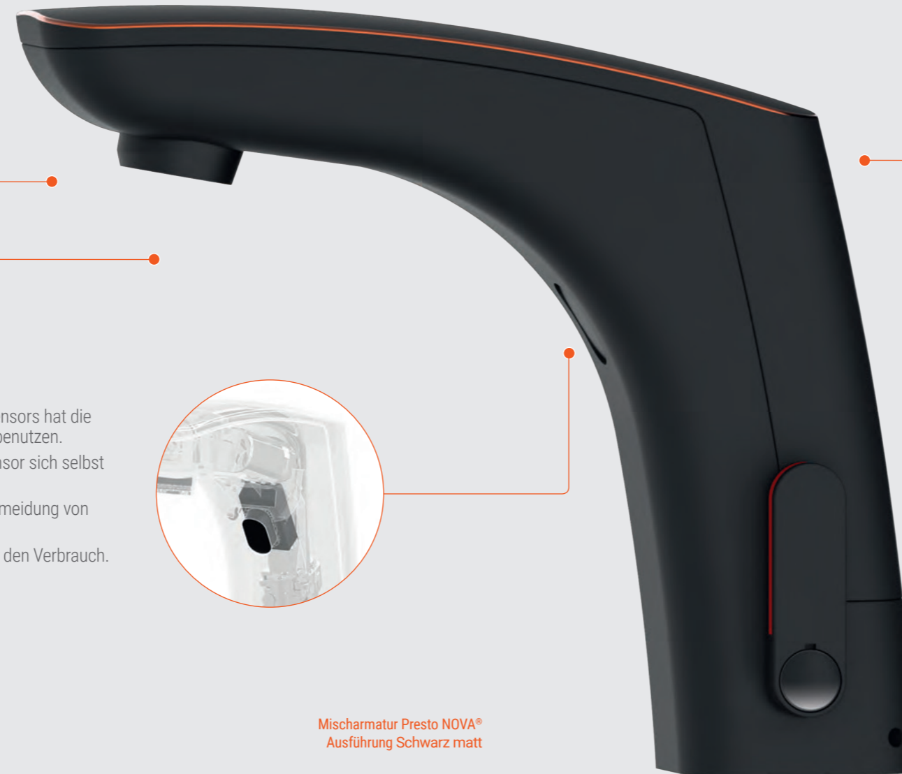
Mischarmatur Presto NOVA ® Ausführung Schwarz matt